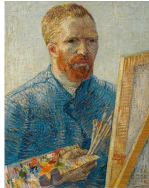
Dette er et av få selvportretter av Vincent van Gogh fra 1887-1888.

Har du hørt myten om at Vincent Van Gogh aldri viste at han var kjent? I flere år har jeg trodd at Van Gogh aldri ble kjent i hans levetid. Han higet etter berømmelse, men fikk aldri den anerkjennelsen han søkte. Berømmelse kommer ikke over natten, det tar ofte flere år med hardt arbeid, også etter sin levetid. «Kunstnere er som regel ikke lenger blant oss når arbeidet deres blir offentlig anerkjent.» Forteller han i et brev til lillebroren, Theo 2. juli 1883. Det er sant, mange kunstnere blir ikke anerkjent og berømt før lenge etter sin død, men slik var det ikke for Vincent Van Gogh.