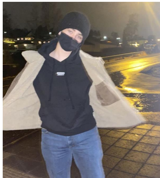
Vennen min en av de første gangene hun brukte maske.

karantene innen julen begynte. Jeg syntes det var rart at når man kommer inn i Norge fra et annen land må man ti dager i karantene og testes, imens i Spania er det