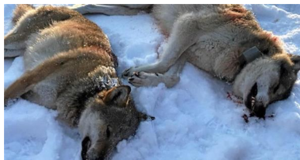
Norsk ulv som har blitt skutt.

Selv om ulven er på Rødlista i Norge er den ikke det i andre deler av verden. For eksempel i Russland og Canada har du en mye høyere ulvebestand og menneskene der lever helt fint med det. Hvorfor klarer ikke nordmenn å leve i harmoni med den norske faunaen?