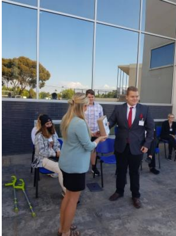
1 - Tyskland mottar vaksinene.